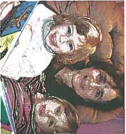
אני לא מתפקדת כסבתא, עם תוכנות

על הילדות במולד: "זו הייתה תקופה של מחסור אמיתי. אם ילד היה זולק חצי סנדוויץ' בביה הספר, הייתי אוספת אותו ואוכלת אותו. הביה היה עצוב. בלי לוקי וסבמאובלי דודים ובני דודים. כשגדלנו הבאתי חברות הבידה, וזה מה שהחזיק את הבית"