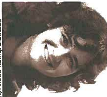
לא שמחה צביאלי בצעירותה

על הילדים והנכדות שיישארו מחוץ לבקתה: "חוץ מהשר הלג שנשאר כפי שהיה, אנחנו זמן נעלמנו להם. הכן הצעיר לא מרוצה כל כך ומנסה לשכנע אותי לשנות את דעתי. הנכדות שלי תמודות להפליא, אבל אני רואה אותן שלוש פעמים בשנה למשך שלושה ימים בלבד"