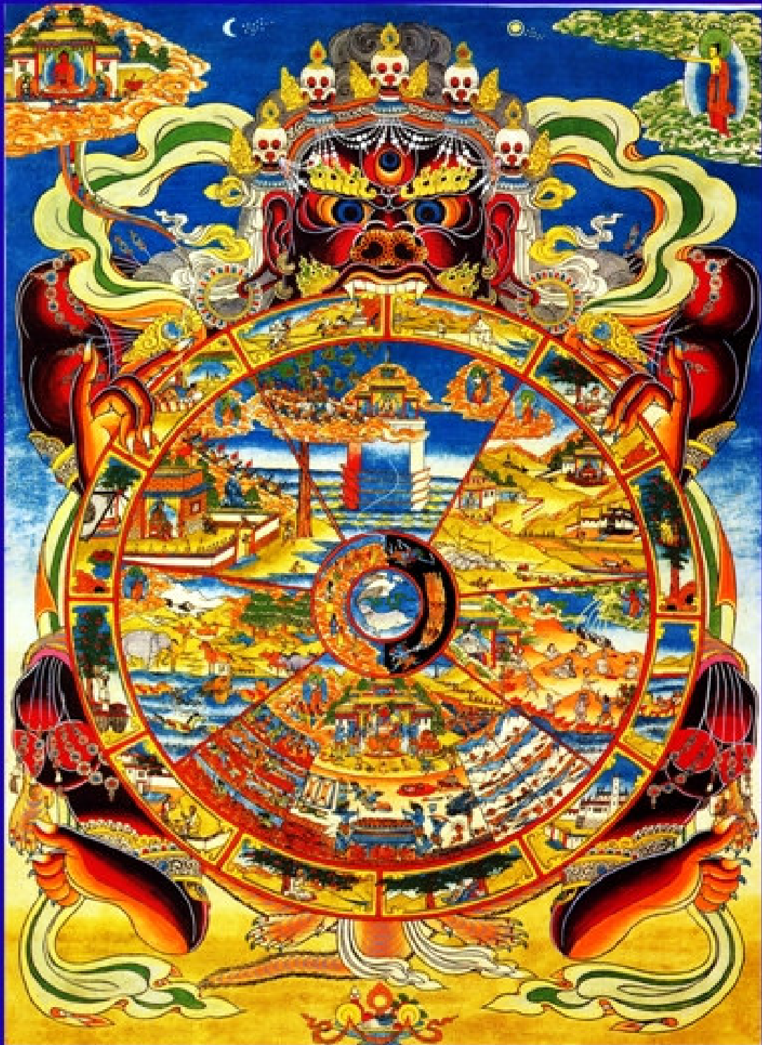
Wheel of Life